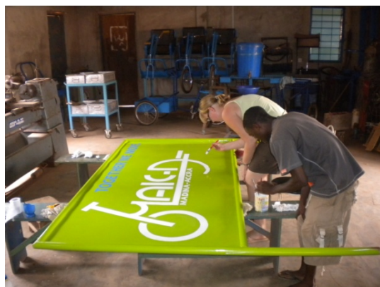
Nieuw uithangbord verven voor Mak-D

Het was belangrijk om langs de verschillende instanties te gaan en te onderzoeken wat voor wensen en eisen ze stellen aan een mobiliteitshulpmiddel en wat voor (financiële) middelen ze hebben om dit soort producten aan te schaffen. Ze hebben ook een inventarisatie gemaakt van de huidige mobiliteitshulpmiddelen, waarbij de belangrijkste vragen waren: Wat gebruiken ze nu? Hoe wordt dat gebruikt? Hoe wordt het gefinancierd? En waar komt het vandaan? Dit alles is belangrijk voor Mak-D om in te spelen op de behoeftes en wensen van de belanghebbenden en hen te betrekken bij het proces. In Ghana zijn ze erachter gekomen dat het belangrijk is om een goed en breed netwerk op te bouwen voor je bedrijf. Dit hebben ze ook geprobeerd te doen samen met Mak-D.