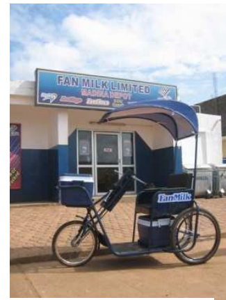
Tricycle van FanMilk

Tijdens de testfase is dit concept bij meerdere multinationals gepresenteerd. Uiteindelijk besloot Fanmilk, fabrikant van voorverpakt ijs en yoghurt, het idee daadwerkelijk te adopteren. Fanmilk verkrijgt hiermee een nieuw distributiekanaal om ijs te verkopen en profileert zich als bedrijf wat maatschappelijk verantwoord onderneemt. Voor de implementatie van het idee zijn er 3 extra modellen gemaakt. Eind juni 2006 is een pilot-project opgestart waarin 3 gehandicapten ijs op straat verkopen, iets dat hopelijk zal resulteren in een goede ijsomzet voor FanMilk, nieuwe orders voor MAK-D en meer gehandicapten die de kans krijgen om een respectvolle baan uit te oefenen!