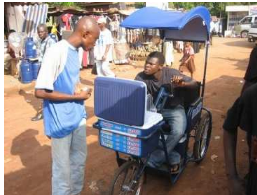
Gehandicapte verkoper aan het werk

Het doel van het project was voor MAK-D een nieuw mobiliteitsmiddel voor gehandicapten te ontwikkelen dat met lokale middelen gemaakt kan worden en onder de lokale omstandigheden gebruikt kan worden. Het tweede doel was dat er voor de subsidieafhankelijke ondernemer een bedrijfsplan wordt opgezet en een marktverkenning wordt gedaan. Dit zal ervoor zorgen dat de werkplaats ook na vertrek een continue productie van mobiliteitshulpmiddelen kan blijven waarborgen.