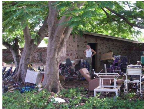
De hulpmiddelen van de Hand in Hand Community

In de buurt van de Hand in hand Community is een werkplaats gevonden die gebruikt mag worden door het projectteam. In deze werkplaats kan het projectteam terecht om hulpmiddelen te vervaardigen en te repareren. Daarnaast vinden in deze werkplaats de praktijklessen voor de "hulpmiddelen cursus" plaats. Door middel van een sollicitatieprocedure zijn zes cursisten geselecteerd uit een groep van verschillende geïnteresseerden. De cursisten doen tijdens de cursus zowel technische kennis en vaardigheden op zoals ontwerpen en construeren, als medische kennis zoals anatomie en fysiologie. Vervolgens moeten ze in groepsopdrachten de opgedane kennis onder begeleiding van de Movendi vrijwilligers in praktijk brengen. Zo is er een loophulpmiddel vervaardigd voor een jongen met balans en coördinatieproblemen en zijn de hulpmiddelen die reeds gebruikt worden aangepast. Ook wordt er orde geschept in de ruime hoeveelheid bruikbare en onbruikbare hulpmiddelen van de Hand in Hand Community (zie foto).