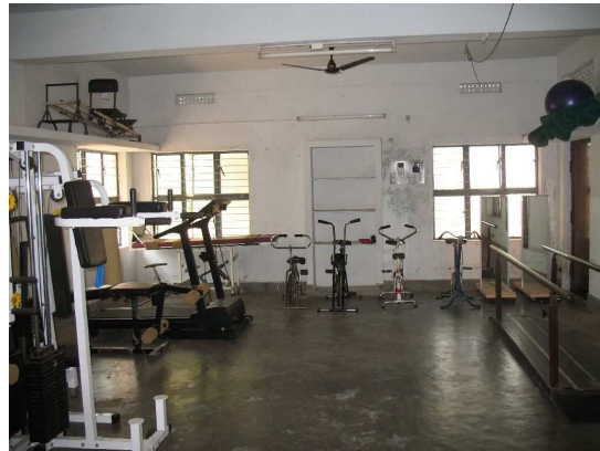
De huidige fysiotherapieruimte

De fysiotherapie/ oefenzaal is sterk verbeterd. Toestellen met gebreken zijn gerepareerd, en beter opgesteld. De ruimte is nu veiliger, functioneler en prettiger ingedeeld. Zowel de fysiotherapeut als de meisjes hebben meer ruimte. Ook zijn er enkele nieuwe oefenmaterialen aangeschaft. Zo zijn er nieuwe matten, fysioballen, wandspiegels, steps, pitzakjes, softballen, wiebeltollen, speelballen en nieuwe elleboogkrukken aangeschaft.