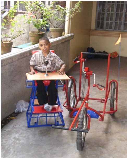
Voorbeeld van een bewegingstechnologisch project

Veel van de gehandicapte kinderen van Operation Hand in Hand hebben geen of een slecht passende rolstoel tot hun beschikking. De incidentele schenkingen van westerse rolstoelen worden zeker geapprecieerd, maar worden niet of nauwelijks gebruikt. Omdat er te weinig kennis en vaardigheden aanwezig zijn, worden ze niet goed afgesteld, laat staan aangepast. Op den duur gaan de hulpmiddelen kapot en worden ze aan de kant geschoven.