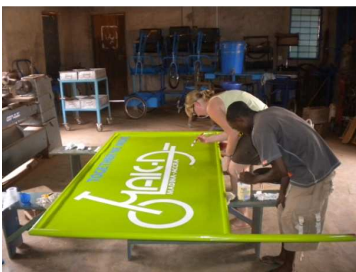
Nieuw uithangbord verven voor Mak-D

Het was belangrijk om langs de verschillende instanties te gaan en te onderzoeken wat voor wensen en eisen ze stellen aan een mobiliteitshulpmiddel en wat voor (financiële) middelen ze hebben om dit soort producten aan te schaffen. We hebben ook een inventarisatie gemaakt van de huidige mobiliteitshulpmiddelen, waarbij de belangrijkste vragen waren: Wat gebruiken ze nu? Hoe wordt dat gebruikt? Hoe wordt het gefinancierd? En waar komt het vandaan? Dit alles is belangrijk voor Mak-D om in te spelen op de behoeftes en wensen van de belanghebbenden en hen te betrekken bij het proces.