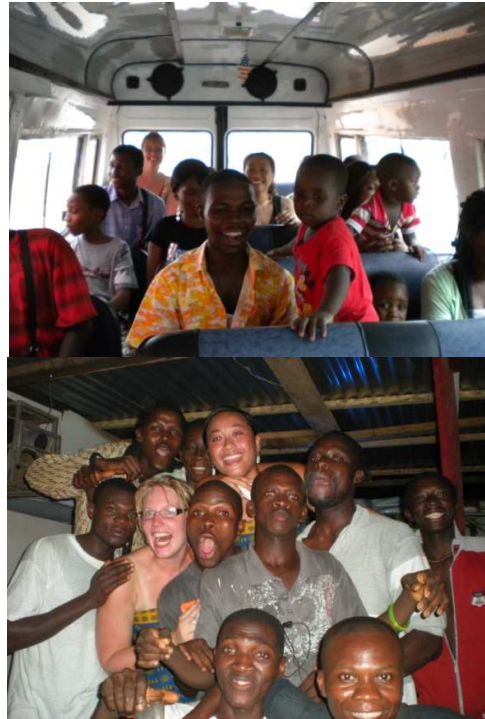
Medaase paa gastfamilies en Mak-D voor een onvergetelijk verblijf in Ghana!