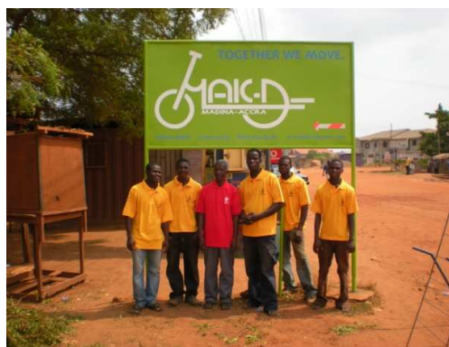
De medewerkers van Mak-D bij hun nieuwe bord